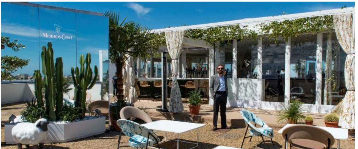
ムートン・カデ ワインバーのテラスに立つフランス人装飾芸術家、マティアス・キス