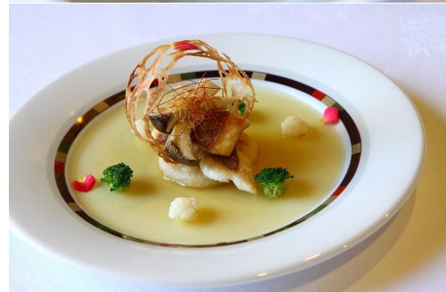
(写真上)IKK賞「宮崎発!!蛤(はまぐり)とめで鯛赤白もち ～トマッチあんソース添え～」、(下)特別審査員賞「幸せのリング」