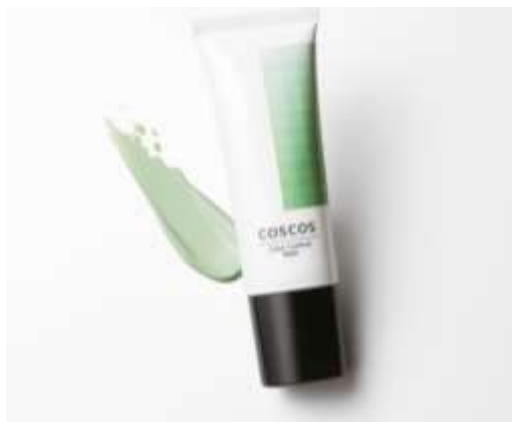
COSCOS カラーコントロールベース（グリーン01） 商品画像