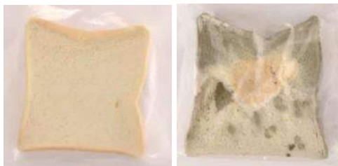
防カビ・抗菌剤で処理した食パンと未処理の食パンを