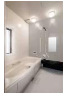
カビダッシュ使用