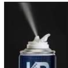
カビダッシュ ユ使用中