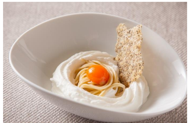
イル・テアトロ LE LUCCIOLE イメージ