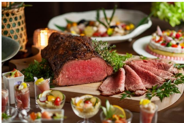
ほたるのタベディナーbuffeイメージ

宵闇に舞う蛍の光。蛍観賞の前にお楽しみいただく、華やかなお食事やトリートメントプランをご用意いたしました。海の高級食材「鮑」や好評の「ローストビーフ」を主役にした「ほたるのタベ ディナーbuffe」や、シェフが蛍の情景を表現したレストランメニュー、特別に閉園後の静けさを取り戻した庭園で蛍を愛でただける「Private Firefly Night Stay」、大人の夜を演出する「ほたるとスタンダードジャズを楽しむタベ」など、この季節限定のプランを各種ご用意いたしております。