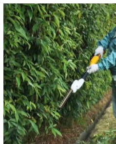
足元の剪定もラクラク。