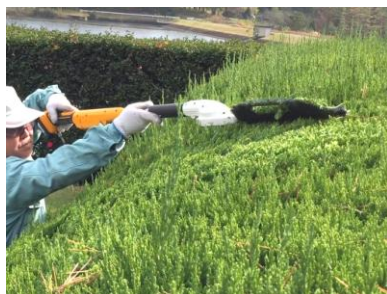
奥行きのある生垣の剪定にも最適。

通常のヘッジトリマと比べると、3.3倍*の作業エリア。広範囲の剪定が可能になるため、効率アップにつながります。 ※ 当社従来品との比較