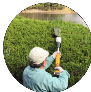
奥行きのある生垣に

ゴルフ場や庭園などでは、景観を保つために日常的に多くの植栽の維持・管理が必要となり、剪定を行う際にはヘッジトリマ等が使用されています。しかし、奥行きや高さのある生垣などは刈刃が届きにくく作業者の負担が大きくなってしまいます。