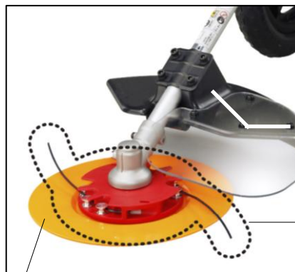
刈刃（あんぜんロータ）： ナイロンコードで草を 刈る刈刃。