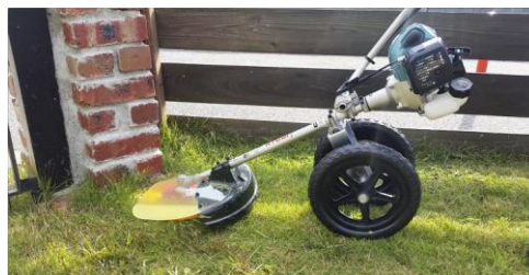
壁のキワ刈りも可能。大型のカバーで飛び散りも防ぎます。

刈刃にナイロンコードを採用しているため、壁などの障害物への接触を気にする必要がありません。壁やフェンスなどのキワ刈りにも最適です。また、大型の飛散防止カバーが付いており、小石や刈草の飛び散りを防ぎます。