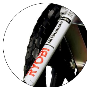
「層状掃気機構」の 高耐久クリーンエンジン搭載(日本製)

農地や河川敷など緑地の雑草刈りに使われる機動性に優れたエンジン式草刈機は、多くの方が使用しています。