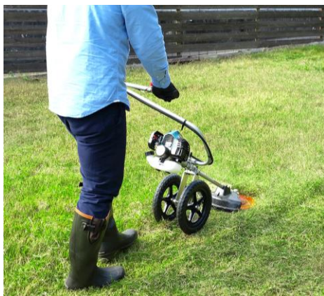
肩や腰に負担の少ないラクな姿勢で作業が行えます。

安定板の付いた手押し式のため、刈刃（あんぜんロータ）を地面に滑らせて草を刈ることができます。刈刃を持ち上げた状態で左右に動かす手持ち式の草刈機とは異なり、手押し式の草刈機は操作が安全で容易に行えます。また、2輪走行なのでしっかりと安定感も確保。作業者の負担も軽減されるため、広い場所や長時間の使用もラクに行うことができます。