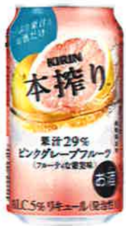
キリン 本搾りチューハイ ピンクグレープフルーツ