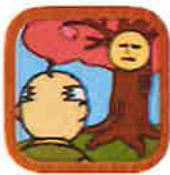
スマホでサクラを育てて満開にできる無料育成ゲーム