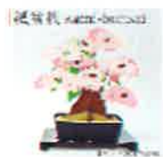
紙を組み立てて作る 自分だけの桜盆栽