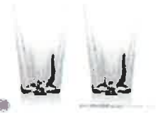
持ち上げるとサクラ模様の水滴が出現するさくらさくグラス