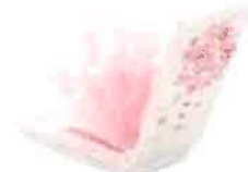
満開の桜をイメージした水を注ぐだけの お手軽な自然気化式加湿器