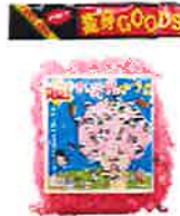
エア花見の主役になれるサクラ色の超お花見アフロ