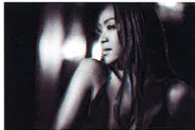
ゲスト クリスタル・ケイ