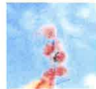
桜と一緒にいられる 押し花スマホケース