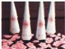
サクラの花びらが飛び散るクラッカー