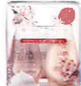
心を満たす桜の香りのシャンプー&トリートメント