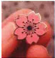
サクラがモチーフのピンバッジ