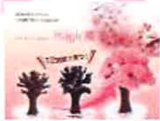
マジックウォーターをかけて置くだけで満開になるパーソナルサクラ