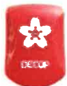
無限にサクラの花びらを切り抜けるエンボスパンチ