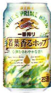
キリン 一番搾り 若葉香るホップ