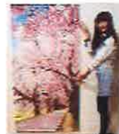
部屋に掛けるだけでお花見特等席が 出現する桜並木タペストリー