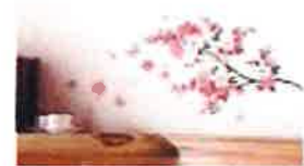
貼ったその場でお花見気分が味わえる ウォールステッカー