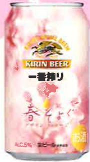
キリン 一番搾り 春そよぐ デザインパッケージ