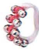
エア花見を盛り上げるサクラ色のベル