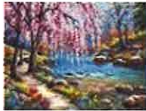
決められた番号に色を付けるだけ完成する 本格的な桜の油絵キット