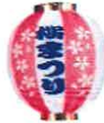
吊るすだけでお祭り気分になれる桜まつり提灯