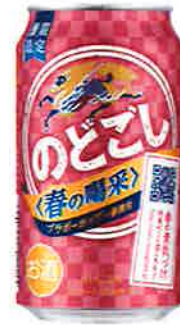
キリン のどし<春の喝采>