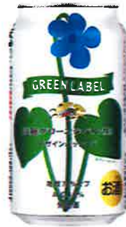
キリン 淡麗グリーンラベル 第一弾 春うららデザイン