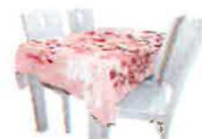
一瞬でお部屋リフォームできる 桜のテーブルクロス

各商品の詳しい情報は、「#エア花見まつり」スペシャルサイト ( http://air-hanami.kirin.jp/ ) から Amazon.co.jp 内の特集ページ「 キリン #エア花見まつり特集2017 」をご覧ください。