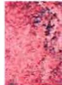
肉眼で見るよりも色鮮やかな 桜の花びらだけの写真集