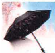
開くだけでその場がお花見会場になる折り畳み傘