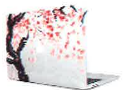
花見大好きをアピールできるパソコンケース