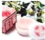
甘くてやわらかな 桜の香りをまとえる香水