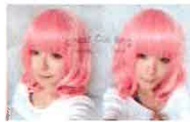
サクラの花びらになった気分になれるサクラ色のウィッグ