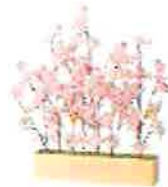
決して散ることなく永遠に楽しめるディスプレイサクラ