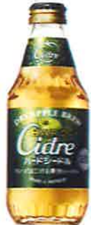
キリン ハードシードル