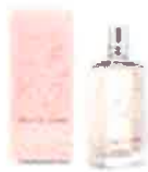
桜の花と実のエッセンスを使用した フレグランス