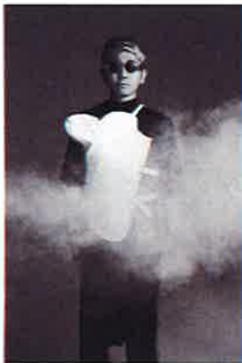
番組ナビゲーター ☆Taku Takahashi (m-flo)