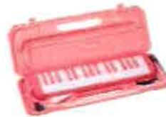
即興で演奏会ができるサクラ色の鍵盤ハーモニカ