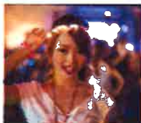
桜ソングを聴きながら踊れる 光るフラワーティアラ