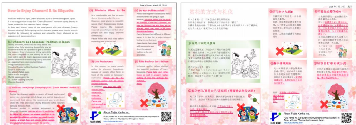
当社で作成したお花見の楽しみ方とマナーを紹介するリーフレット ※英語版/中国語版を用意

多くの訪日外国人を受け入れるホテルの責務として地域の魅力発信に貢献すべく、マナーの啓蒙と日本文化の紹介を目的としたリーフレットの配布を今年も実施することにいたしました。