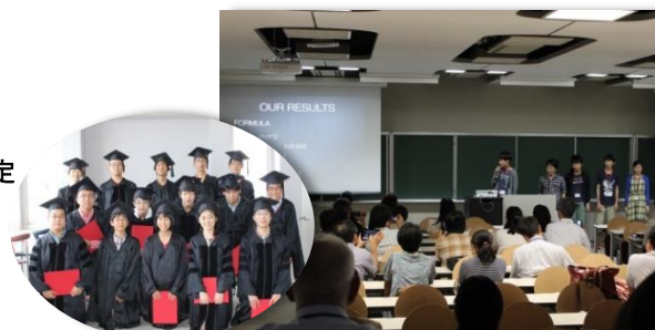
サマープログラム修了式の様子と発表風景