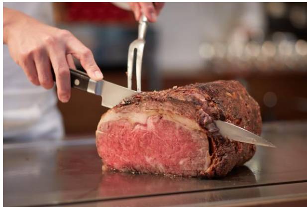
鉄板ローストビーフ