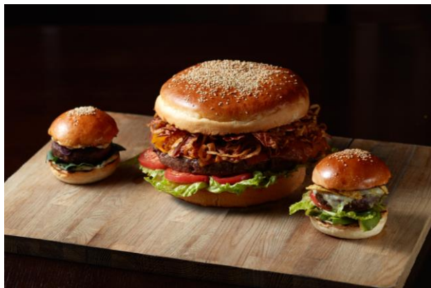
ジャイアント オークドア バーガー

都会の喧騒にそびえ立つダイナミックなラグジュアリーホテル、グランド ハイアット 東京(東京都港区、総支配人：スティーブ ディワイヤ)では、鉄板焼でご提供する国産黒毛和牛のサーロインをつかったローストビーフと、1kgのパティをつかい通常の約5倍の大きさのジャイアントハンバーガーを期間限定でご提供いたします。春の集まりに、インパクト抜群のサプライズ感あふれるメニューを存分にお楽しみください。