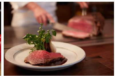
鉄板ローストビーフ(イメージ)