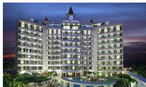
パークホテルクラークキー 外観