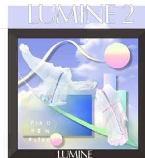
<ウインドウディスプレイ展開イメージ>