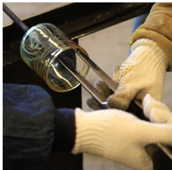
吹きガラス体験（箱根クラフトハウス）