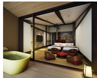
露天風呂付最上階客室 (完成イメージ)