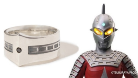
PUERTA DEL SOL × A MAN of ULTRA ウルトラセブンリング TYPE-1 20,520 円(税込)