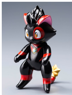
【数量限定】MAX TOY ウルトラニャン 黒猫スペシャル 5,400 円(税込)

同時開催の『円谷プロダクションクリエイティブジャム』では、TCJ限定カラーやスワロフスキークリスタルで装飾されたソフビフィギュアなど多数の人気作品が展示・販売されます。