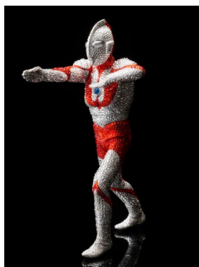
アトリエジュミニー ウルトラマンスワロフスキー 324,000 円(税込)