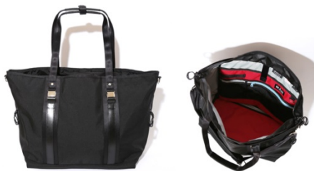
beruf baggage × A MAN of ULTRA アーバンコンピューター2WAYトートバッグ HD (ウルトラマン) 38,880 円(税込)