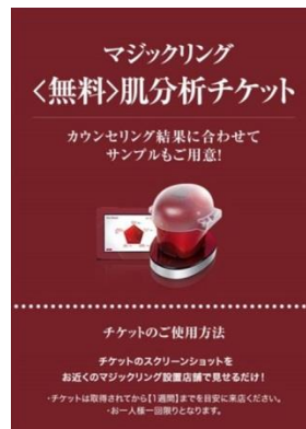
無料肌分析チケット(イメージ)

定期的なお肌のチェックは美肌の大切なステップです。スキンケアや SK-II Beauty Tips を実践したら、1ヶ月後に再びマジックリングを受けてみましょう。