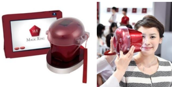
肌分析マシン「マジックリング」

そして、マジックリングや製品を試した「あなたの SK-II 体験」を投稿していただくと、抽選で SK-II フェイシャル トリートメント エッセンス一年分(6本)が当たる「SK-II Challenge Twitter キャンペーン」を、SK-II 公式 Twitter (@SKII_Japan)にて同日より実施します。(詳細は3頁目をご覧ください。)