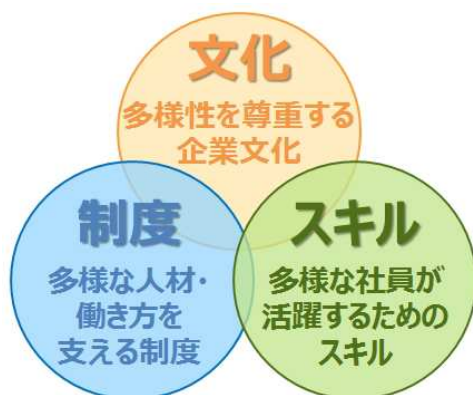
P & Gのダイバーシティ&インクルージョンを支える3本柱

P & Gでは、経営戦略の一環として「ダイバーシティ&インクルージョン（多様性の受容と活用）」を掲げ、「文化」「制度」「スキル」を3本柱に、1992年から約25年にわたって、女性活躍推進、ダイバーシティ&インクルージョンの推進、多様な社員一人ひとりが能力を最大限に発揮できる組織づくりに取り組んでいます。