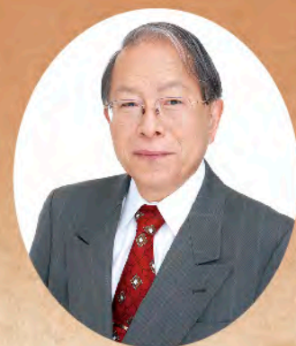
静岡大学名誉教授 講師：小和田 哲男氏