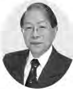
小和田 哲男 Tetsuo Owada

1944年静岡市生まれ。1972年早稲田大学大学院文学研究科博士課程修了。現在、静岡大学名誉教授、文学博士、公益財団法人日本城郭協会理事長。専門は日本中世史、特に戦国時代史で、主著『後北条氏研究』『近江浅井氏の研究』のほか、『小和田哲男著作集』などの研究書の刊行で、戦国時代史研究の第一人者として知られている。NHK総合テレビおよびNHK Eテレの番組などにも出演し、わかりやすい解説には定評がある。NHK大河ドラマでは、1996年の「秀吉」、2006年の「功名が辻」、2009年の「天地人」、2011年の「江～姫たちの戦国～」、2014年の「軍師官兵衛」で時代考証をつとめ、2017年の「おんな城主直虎」も担当する。主な著書は、『戦国の群像』(学研新書)、『戦国の城』(学研M文庫)、『名城と合戦の日本史』(新潮文庫)、『井伊直虎 戦国井伊一族と東国動乱史』(洋泉社歴史新書y)など多数。