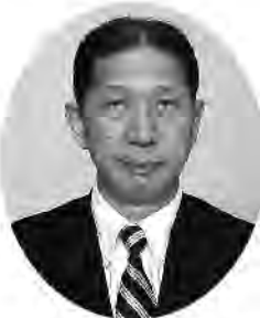
中井 均 Hitoshi Nakai

1944年静岡市生まれ。1972年早稲田大学大学院文学研究科博士課程修了。現在、静岡大学名誉教授、文学博士、公益財団法人日本城郭協会理事長。専門は日本中世史、特に戦国時代史で、主著『後北条氏研究』『近江浅井氏の研究』のほか、『小和田哲男著作集』などの研究書の刊行で、戦国時代史研究の第一人者として知られている。NHK総合テレビおよびNHK Eテレの番組などにも出演し、わかりやすい解説には定評がある。NHK大河ドラマでは、1996年の「秀吉」、2006年の「功名が辻」、2009年の「天地人」、2011年の「江～姫たちの戦国～」、2014年の「軍師官兵衛」で時代考証をつとめ、2017年の「おんな城主直虎」も担当する。主な著書は、『戦国の群像』(学研新書)、『戦国の城』(学研M文庫)、『名城と合戦の日本史』(新潮文庫)、『井伊直虎 戦国井伊一族と東国動乱史』(洋泉社歴史新書y)など多数。