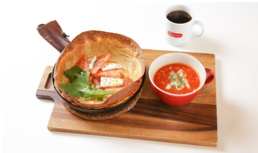
「パンネクック トマトのしずく」

また、映画『トマトのしずく』のチケット半券をご提示いただくと「パンネクック トマトのしずく」を半額の700円(税込)でご注文いただけます。