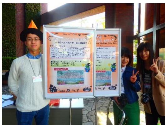
モザイクアートに使用する写真撮影風景

※ 教員地域貢献活動支援事業（協働型）：自治体・企業・NPO 等の団体から地域課題を提案してもらい、YCU 教員が課題提案者と協働で調査、研究、社会実験などの活動を通じて、その課題解決を目指す事業。平成 23 年度から実施しており、平成 25 年度文部科学省「地（知）の拠点整備事業（大学 COC 事業）」に YCU が採択されたことで、事業拡大を図っている。