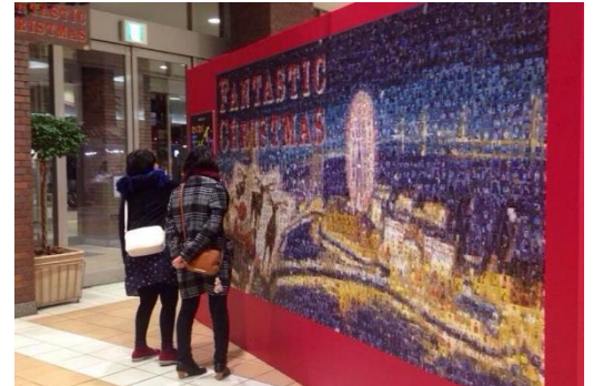
平成 26 年 12 月に展示したモザイクアート