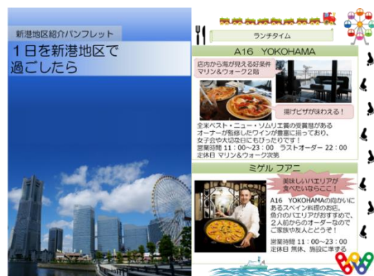
新港地区紹介パンフレットのイメージ