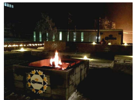
天空の Corona Night Bar