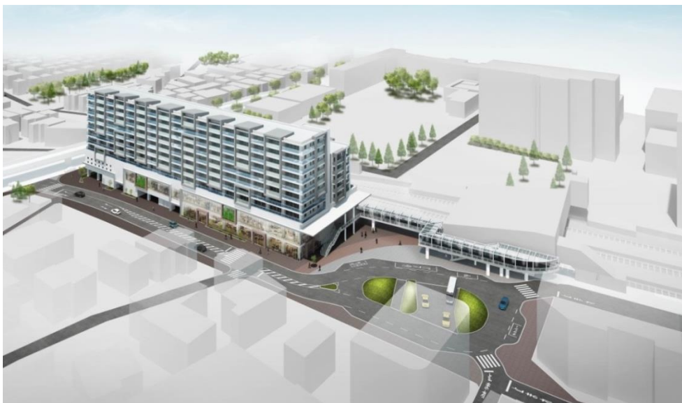
施設建築物のイメージパース

大京は当事業において、商業・公益施設・都市型住宅などの10階建て施設建築物の3～10階部分に146戸の分譲マンションを供給する予定です。都市機能の整備促進を通じて、瀬谷駅周辺の魅力とにぎわいの向上に貢献してまいります。