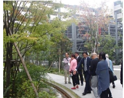
見学会当日の様子