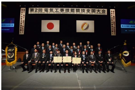
受賞者と 後援・主催 関係者一同