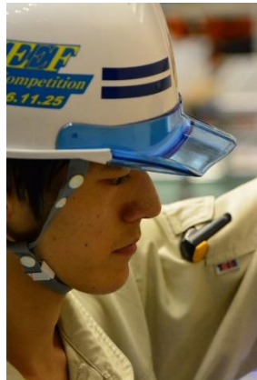
高校生の部最優秀賞受賞者