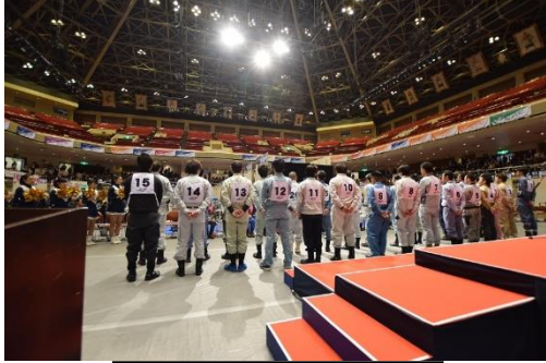
開会式（一般の部選手整列）