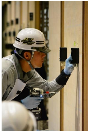
一般の部金賞受賞者