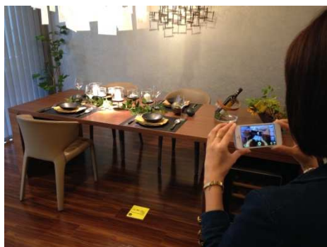
スマートフォンなどでアプリを起動し、専用マーカールを読み込むだけで原寸大のインテリアを3Dで表示できる

また、同時にリニューアルされる「iLMiO」は、現在三井不動産グループ企業のお客様を中心に配信しているアプリとなりますが、今後は「iLMiO AR」と連携しより多くのユーザーの皆様にご利用いただけるよう、サービスを拡充していく予定です。