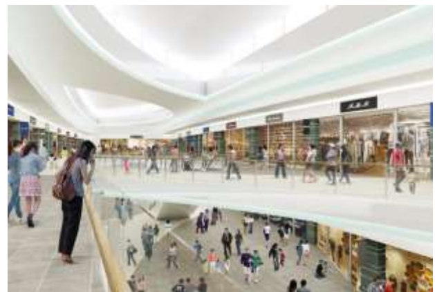
第2期イメージパース