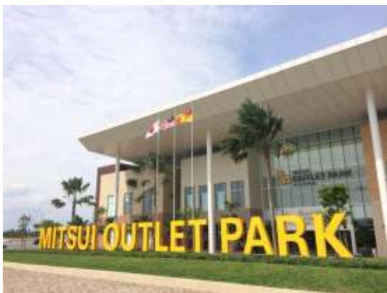
三井アウトレットパーク クアラルンプール国際空港 セパン外観