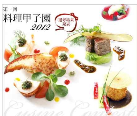
料理甲子園メインビジュアル