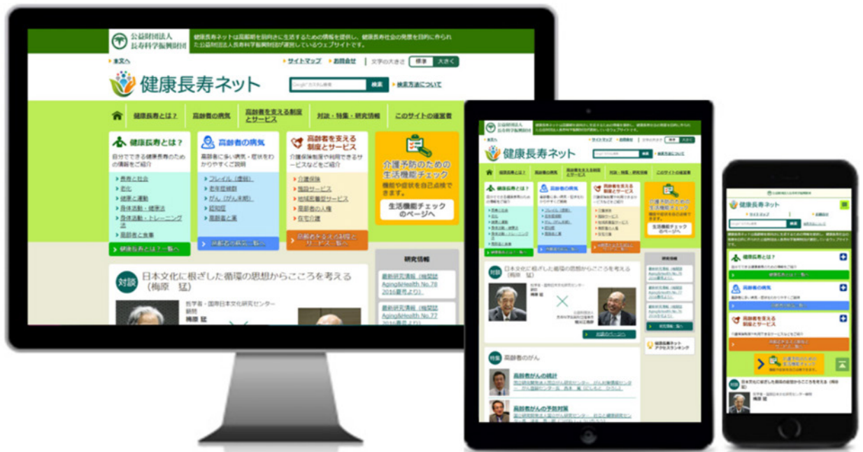
健康長寿ネット ( https://www.tyojyu.or.jp/net/ )