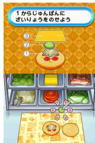
【チーズバーガーづくり】