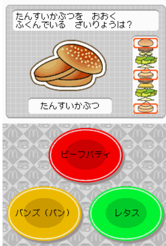
【しよくいくクイズ】