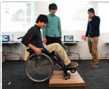
機械系ものづくり産業地域との連携による技術イノベーション創出のための実践教育(主な連携先:川口市)