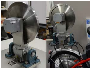
低炭素パーソナルモビリティと移動情報ネットワークサービスの開発(主な連携先:さいたま市)