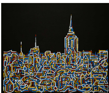
Good Night (Manhattan), 2014 Krink on canvas 20 x 24"