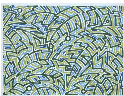
Summer Breeze, 2016 Acrylic on canvas 36 x 48"