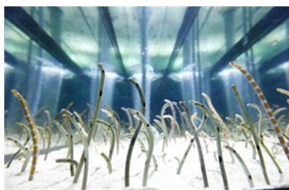
チンアナゴたちが群れを成す水槽