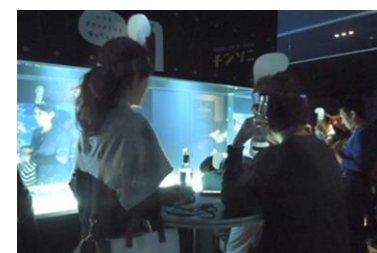
チンソニbar ※昨年の様子