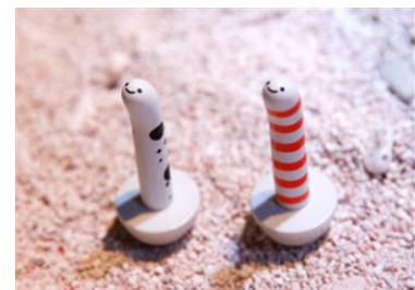
きょうもゆらゆらチンアナゴ（ゆらチン）