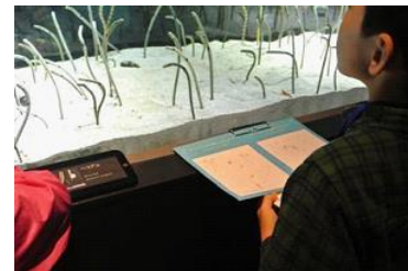
チンアナゴのいただきます