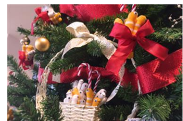
チンアナゴツリー ※昨年の様子

展示内容：チンアナゴ、ニシキアナゴのマスコットやぬいぐるみで装飾した、高さ3メートルの特製クリスマスツリーです。チンアナゴとニシキアナゴ盛りだくさんで賑やかに演出します。