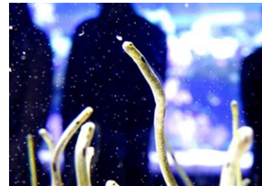
チンアナゴのさあ、ゴハン！