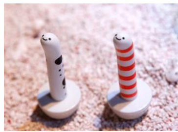
きょうもゆらゆらチンアナゴ(ゆらチン)