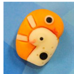
水族館和スイーツ チンアナゴ&ニシキアナゴ

販売内容：お土産として人気の「水族館和スイーツ」シリーズにチンアナゴ&ニシキアナゴが漸登場します。マンゴー味練り切りで、見た目も可愛らしくプレゼントにもぴったりな一品です。