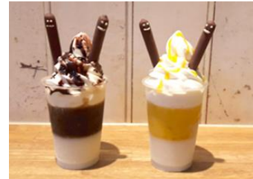
ゆらチンポッキーパフェ

江崎グリコは11月11日を「ポッキー&プリッツの日」と定め、日本記念日協会の認定を受けています。ポッキーとプリッツは、スティック状菓子の代表的な存在で、その形が数字の“1”に似ていることから、平成11年11月11日の“1”が6個並ぶおめでたい日にスタートしました。秋の行楽シーズンに合わせて、お客さまへの感謝の気持ちを込めて、毎年キャンペーンを実施しています。