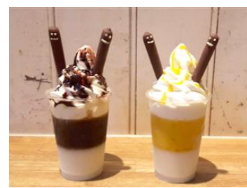
ゆらチンポッキーパフェ