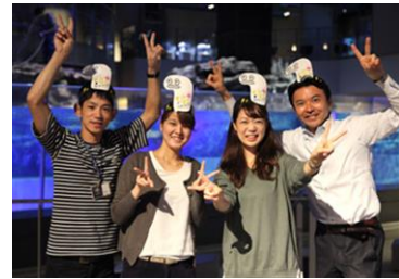
17時からは、お客さまもスタッフもチンアナゴのお面をつけます！