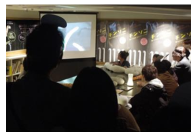
チンアナゴアカデミー ※昨年の様子