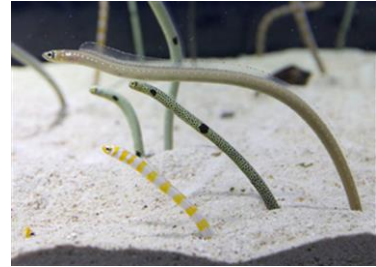
左からニシキアナゴ、チンアナゴ、 ホワイトスポテッドガーデンイール

ウナギ目アナゴ科の仲間。温暖で潮通しの良い砂地に生息。巣穴を掘って生活し、時には大きな群れを作る。日中は体を伸ばし流れによってきた動物プランクトンを捕食する。