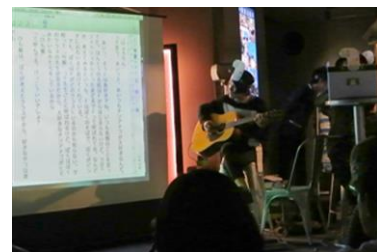
チンソニ即興小説 ※昨年の様子