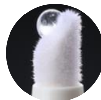
ファイバーヘッド拡大