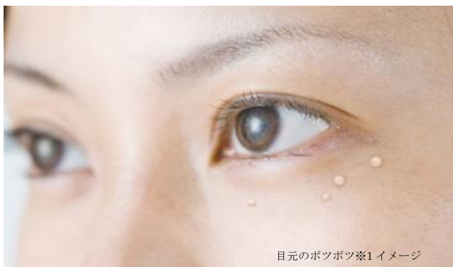
目元のポツポツ※1 イメージ

■つぶぼろん目元温和漢 EC サイト： http://nonplex.jp/item/1510