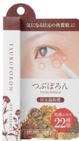
つぶぽろん目元温和漢(めもとおんわかん)