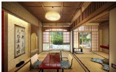
「箱根湯本」江戸時代：大正好み