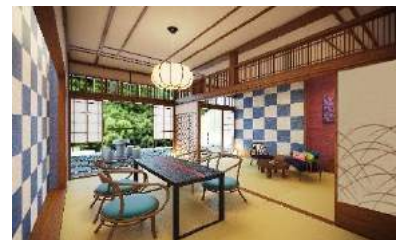
「小涌谷」大正時代：ハイカラ