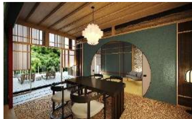
「仙石原」広大なすずき野原：うつろひ