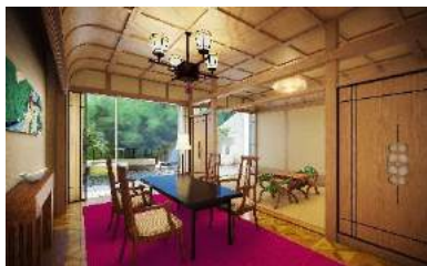
「宮ノ下」明治時代：西洋ロマン