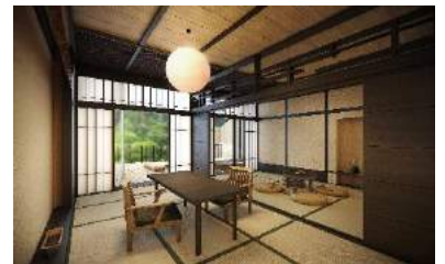
「芦ノ湖」湖畔のリゾート：ひねもす