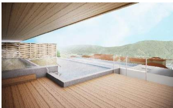
6階大浴場 露天風呂