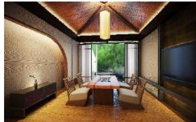
「大涌谷」雄大な自然：つれづれ