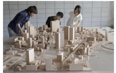
学生によるジオラマ都市模型を展示。住民がまちづくりに関心を抱き、街は共有財であるという視点を育む役割を持たせた