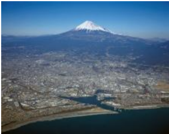
【富士山とその風景】