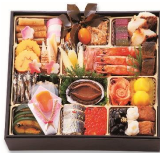
和一段 21,600 円