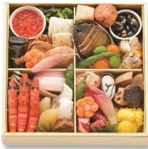
和一段 21,600 円

和一段に加え、美味しいものを少量ずつ多種詰め合わせた「和・洋」、「和・洋・中」の各一段を、今年初めてご用意しました。