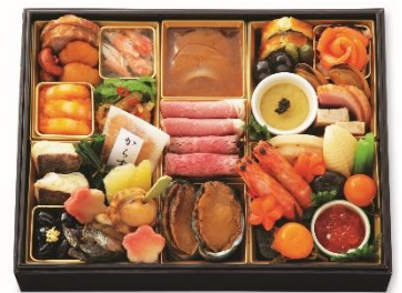
和・洋・中一段 21,600 円