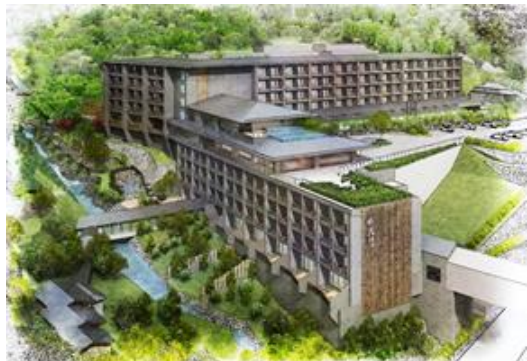
箱根小涌園 天悠 全景