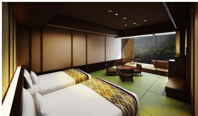
【露天風呂付客室】完成イメージ

2017年4月20日(木)開業決定。150室の客室全室に温泉露天風呂を備えた旅館スタイルの宿泊施設。