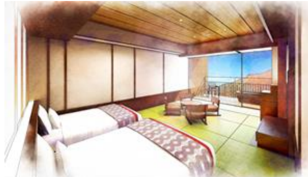
箱根小涌園 天悠 客室一例