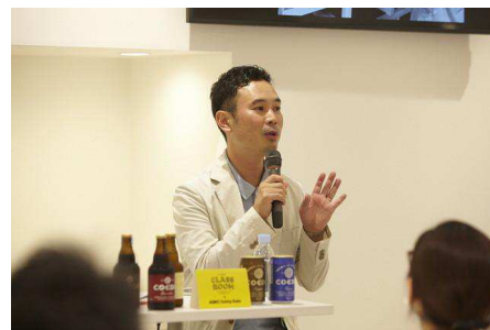
特別講座 「ゆっくり流れる時間を愉しむクラフトビール」

参加された方からは、“学びの場で「勉強」というより楽しく学べて自分の生活に役立てられる” “参加者や講師の方々と交流があって良い” といったお声をいただきました。