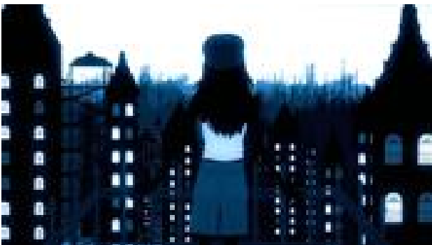
「太陽と星空のサーカス」