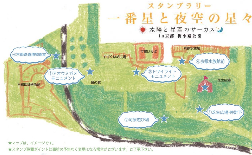
梅小路公園スタンプラリー「一番星と夜空の星々」マップ

「太陽と星空のシアター」で毎回必ず上映するオリジナル映画「太陽と星空のサーカス」に沿ったスタンプラリーです。梅小路公園内にある6つのスタンプをすべて集めると、ドームテントに飾る星飾りと交換いただけます。また、スタンプ設置予定箇所には、絵本「太陽と星空のサーカス（作画・いでたつひろ）」の複製原画を展示予定です。作品の世界観やストーリーを幻想的なイラストとともに追いながら、スタンプラリーをお楽しみください。