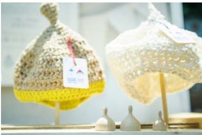
「ワンダーバザール」イメージ

期間中入れ替わりで、さまざまな店舗があわせて約 50 店舗ほど出店する蚤の市「ワンダーバザール」では、アクセサリや布小物、使い込まれたアンティーク家具などの選りすぐりの品が集まります。「遊ぶの教室」では、大人も子どもも同じ目線で「遊ぶ・楽しむ・作る」というコンセプトのもと、自分だけのオリジナルアイテムを作ることができるなど、ひとりひとりがアーティストになれるワークショップを体験いただけます。また、「ヤムヤムマーケット」では、こだわりの手作りパンや焼き菓子屋さんなど、日によっても違うさまざまなおいしいご飯や飲み物のお店が出店します。