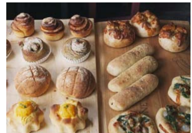
「YUM YUM MARKET (ヤムヤムマーケット)」イメージ