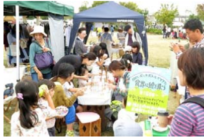
「遊ぶの教室」イメージ