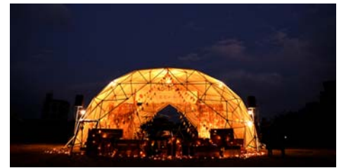
「ドームテント」イメージ

「太陽と星空のシアター」で毎回必ず上映するオリジナル映画「太陽と星空のサーカス」に沿ったスタンプラリーです。梅小路公園内にある6つのスタンプをすべて集めると、ドームテントに飾る星飾りと交換いただけます。また、スタンプ設置予定箇所には、絵本「太陽と星空のサーカス（作画・いでたつひろ）」の複製原画を展示予定です。作品の世界観やストーリーを幻想的なイラストとともに追いながら、スタンプラリーをお楽しみください。