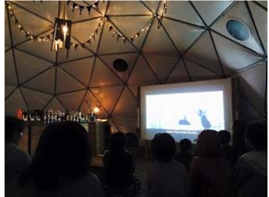
「太陽と星空のシアター」イメージ

「太陽と星空のサーカス」のビッグアイコンである巨大テントを映画館にしました。期間中は「太陽と星空のサーカス」、「つみきのいえ」、「カーリーノ・コニ」、「或る旅人の日記」、「Step and Move!」の5作品を上映し、無料で鑑賞いただけます。