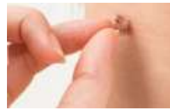
③ 優しく剥がし取る