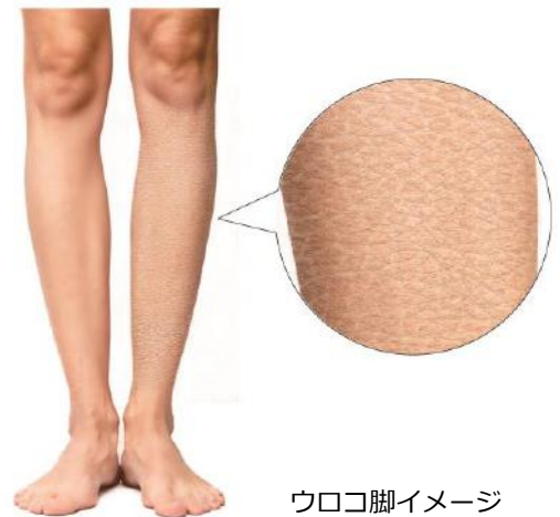
ウロコ脚イメージ

今回発売するリレッグは、冬のカサカサ「ウロコ脚」をケアするスネ用のスキンケア商品です。冬になると肌の乾燥が気になりますが、特にスネは乾燥が目立ちやすく、皮膚表面がウロコのような脚になってしまう方も。スネは他の体のパーツと違い、皮下脂肪が少なく水分を失いやすいと言われており、ムダ毛処理や外部からの刺激により皮膚が傷つきダメージを受けることが多い部分です。さらに、化学繊維のストッキングやレギンスの着用機会が増えることも乾燥の原因となります。乾燥がひどい方は、ストッキングを脱いだときに角質の白い粉が落ちることもあります。