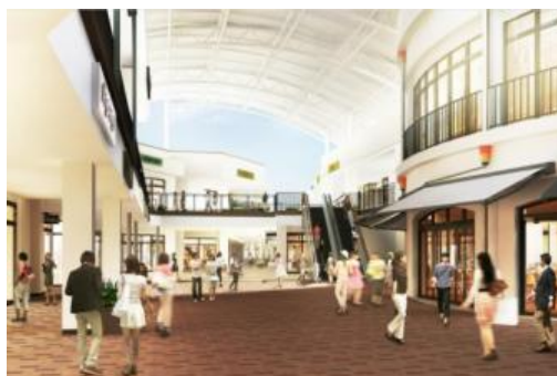
第5期と既存施設の接続部