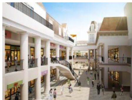
既存施設リニューアル後