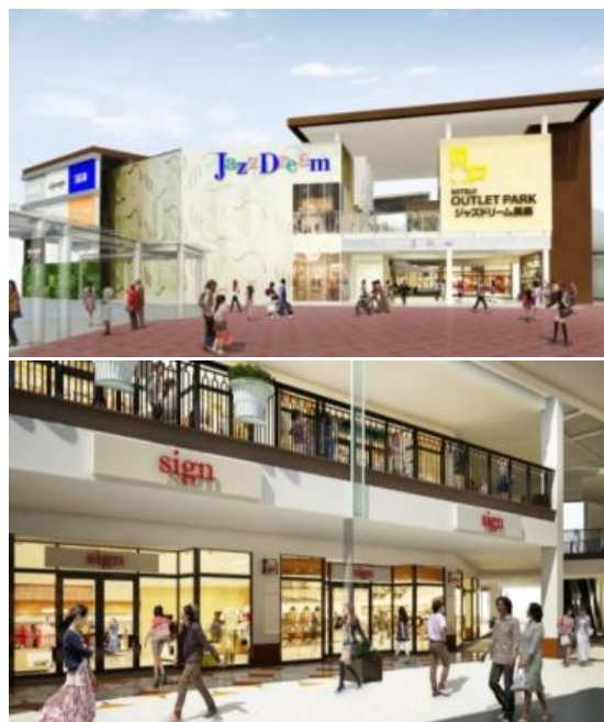
(上)第5期南エントランス (下)第5期内観

■ 当施設は、「ナガシマリゾート」の一角に位置しています。周辺は、長島観光開発株式会社が運営する総合レジャーランドがあり、遊園地の「ナガシマスパーランド」、温泉施設の「湯あみの島」、花と食のテーマパーク「なばなの里」の他、高級温泉旅館「ホテル花水木」など、観光集客施設が集積した東海エリア屈指の一大レジャーゾーンです。本年7月には「ジャンボ海水プール」内に日本初&世界最大級の大型複合ウォーターアトラクション「ジャパーン」が新たにオープンし、来年春には遊園地に4Dスピンコースター「嵐」も導入予定です。今回のアウトレットモールの第5期開発計画により、ナガシマリゾート全体が、より一層魅力的なエリアになります。