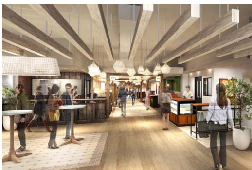
『ルミチカ FOOD DEPOT』完成イメージ

※食品フロアリニューアルに関する詳細のリリースは、9月下旬にお届けする予定です。