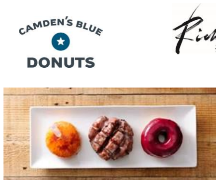
9月6日(火)オープンの NEW SHOP