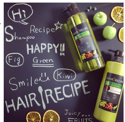
<Mariko さんによる投稿イメージ>