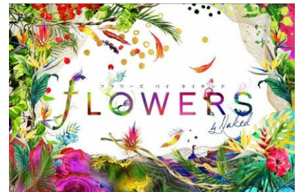
<「FLOWERS BY NAKED」ロゴ>