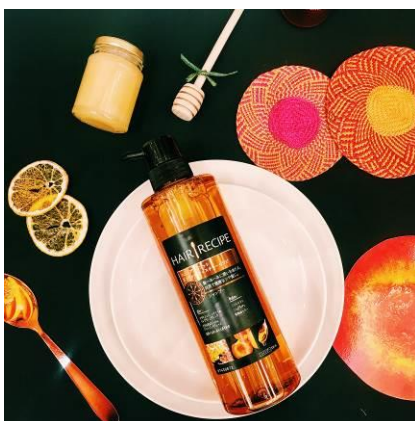
<「ヘア レシピ」フォトブースイメージ>