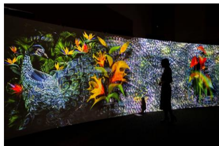
＜「FLOWERS BY NAKED 魅惑の花園」展示イメージ＞