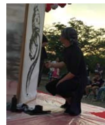
墨絵ライブイメージ

戦国武将を中心に動物・自然を題材に書を書くように命を描き、墨に濃淡をつけない独自のスタイルを考案し、白と黒のコントラストの美しさを追求。日本各地でのイベントパフォーマンスや個展を開催。