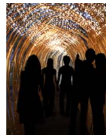
輝きの道イメージ

イルミネーションデザイン監修:照明デザイナー/NAIKIDESIGN INC.内木宏志