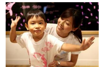
「北斎金魚 T シャツ」

開催期間：2016年7月16日(土)～8月11日(木・祝) 開催時間：11時00分～16時00分(最終受付15時30分) 参加料金：500円(税込) 開催内容：葛飾北斎が描いた金魚の絵柄のスタンプを押してオリジナルTシャツを作ることができます。