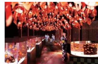
「お江戸の金魚ワンダーランド」イメージ

開催期間：2016年7月1日(金)～9月30日(金) 開催内容：日本最大級、全長100メートルの金魚展示ゾーンで約23品種、約1000匹の金魚が泳ぐ、金魚づくしの夏イベントです。金魚ちょうちんや江戸風鈴による期間限定の演出や、親子で参加できる体験プログラム、期間限定の金魚メニューが満載です。お江戸の金魚の魅力に触れながら、金魚づくしの夏をぜひお楽しみください。