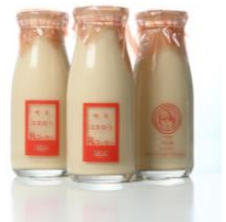
はまゆう乳コーヒー (350円/通常サイズ)