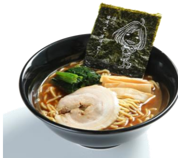
大久保佳代子の 締めラーメン(魚介醤油味) 800円