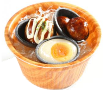
小涌園のわき園名物 黒タマ(大人味・子供味)500円