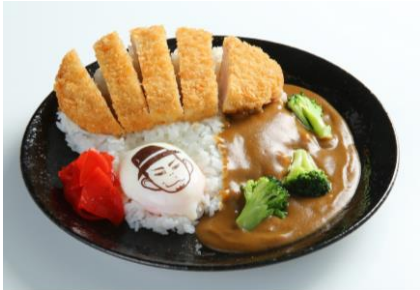
E村Pがいつも食べてる フジテレビ社員食堂 AOMIの カツカレー 950円