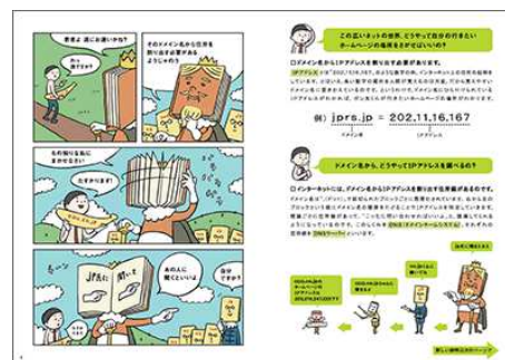
～マンガ小冊子 内容イメージ～

※本年度の小冊子配布活動は 2016 年 6 月 30 日（木）をもって終了しましたが、参考 URL 『ポン太のネットの大冒険』より、PDF 形式にてダウンロード・閲覧が可能です。