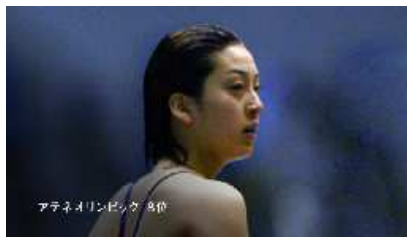
アテネオリンピック 8位