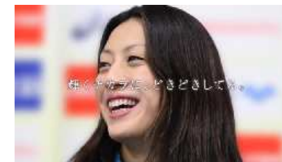
輝くチカラに、どきどきしてる。