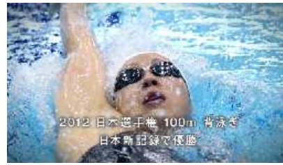
2012年 日本選手権 100m 背泳ぎ 日本新記録で優勝