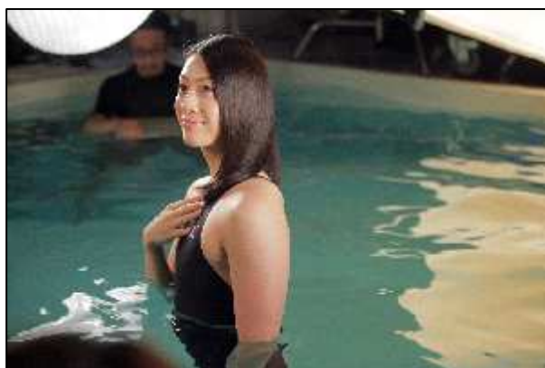
キャンペーン用 キービジュアル撮影風景