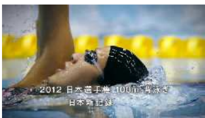
2012 日本選手権 100m 背泳ぎ 日本新記録で優勝