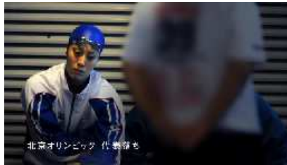
北京オリンピック代表落ち