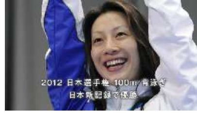
2012年 日本選手権 100m 背泳ぎ 日本新記録で優勝