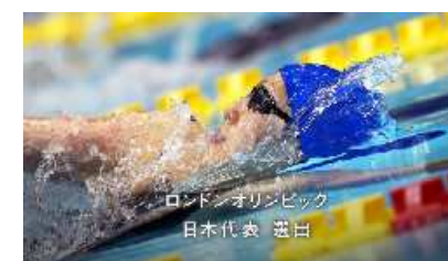
ロンドンオリンピック 日本代表選出