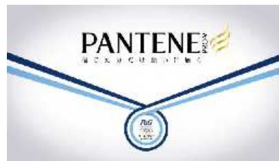
信じた分だけ願いに届く