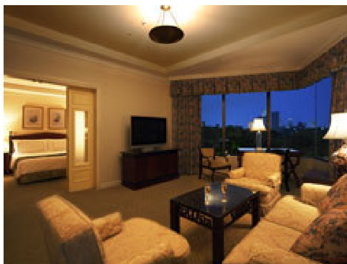
エグゼクティブスイート