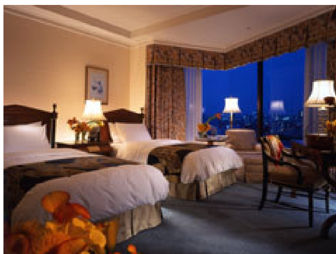
スーペリアルーム シティビュー